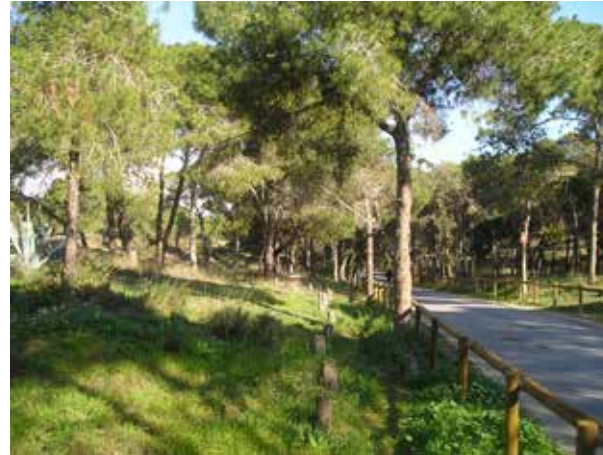
Pinada de Guardamar G.T.

En medio de todo, estratégicamente situado, está Guardamar, un municipio de 35 km 2 y 17.000 habitantes -en las temporadas bajas- situado a 30 minutos del Aeropuerto de Alicante. Su pinada dunar tiene cerca de 1.000 hectáreas con 11 km de playa de arena blanca, al norte y al sur de la desembocadura del Río Segura. La zona arbolada protegida, el sistema de dunas y los campos de regadío y de secano son casi el 80% de la superficie del término.