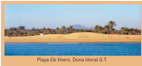
Playa Els Vivers. Duna litoral G.T.

La villa ofrece tanto el ambiente típico de las pequeñas ciudades españolas como una atmósfera internacional única en la Comunitat Valenciana. El personal de la Oficina de Turismo -un departamento municipal- estará encantado de ayudarle a organizar su viaje de amante de las aves. Disponemos de cerca de 5.000 plazas de alojamiento en acogedoras pensiones, pequeños y grandes hoteles, apartamentos o un camping de 5 estrellas con bungalows cerca de la desembocadura del río.