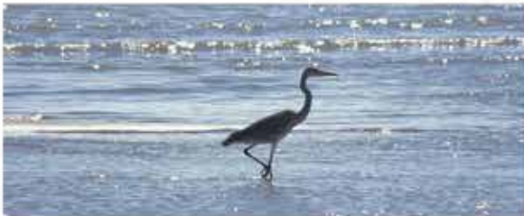
Garza real ( Ardea cinerea ) en la playa Els Tossals de Guardamar P.G.