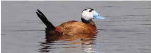
Malvasía cabeciblanca ( Oxyura leucocephala ) V.S.