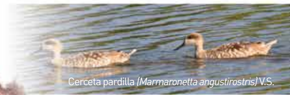
Cerceta pardilla ( Marmaronetta angustirostris ) V.S.