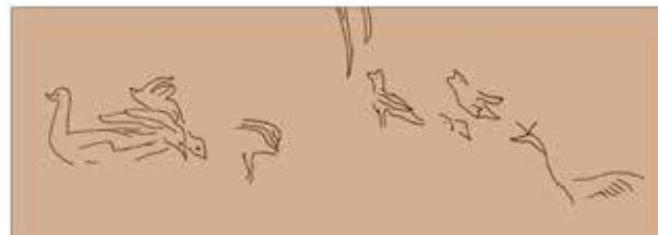
Dibujos de pájaros verdes de la Rábida Califal de Guardamar s. X, de M a Jesús Rubiera Mata, Universidad de Alicante

Guardamar es un lugar de larga tradición pesquera y agrícola -aún practicadas en la actualidad-. Los arqueólogos hallaron largos túneles con nidos del abejaruco europeo ( Merops apiaster ) en las murallas arenosas de "La Fonteta", una colonia fenicia del siglo VIII a.C., junto a la desembocadura del río. En ese mismo yacimiento, se encontraron en uno de los muros del ribat -o monasterio islámico- del siglo X, dibujos en color verde que representan unas aves bajo una palmera. Permanecieron sepultadas bajo la arena durante mil años hasta su descubrimiento a finales del siglo XX. Los pictogramas representan unas garzas azules ( Ardeo purpurea ), ánades o patos reales ( Anas platyrhynchos ) y otras pequeñas aves.