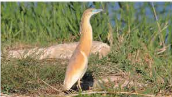
Garcilla cangrejera ( Ardeola ralloides ) V.S.