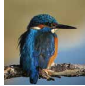
Martín pescador ( Alcedo atthis ) en la desembocadura del río Segura A.H.S.A.

La villa ofrece tanto el ambiente típico de las pequeñas ciudades españolas como una atmósfera internacional única en la Comunitat Valenciana. El personal de la Oficina de Turismo -un departamento municipal- estará encantado de ayudarle a organizar su viaje de amante de las aves. Disponemos de cerca de 5.000 plazas de alojamiento en acogedoras pensiones, pequeños y grandes hoteles, apartamentos o un camping de 5 estrellas con bungalows cerca de la desembocadura del río.