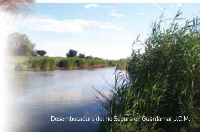
Desembocadura del río Segura en Guardamar J.C.M.