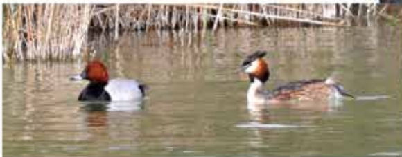
Porrón común ( Aythya ferina ) y Somormujo lavanco ( Podiceps cristatus ) V.S.

Texto: Joan-Carles Martí i Casanova Mapa: Amigos de los Humedales del Sur de Alicante A.H.S.A. Fotos: Vicent Sansano (Director del Parque Natural El Hondo Elx-Crevillent) V.S.; Joan-Carles Martí J.C.M.; José Antonio Mesequer J.A.M.; Pedro Grimao P.G.; Parque Natural Lagunas de La Mata P.N.L.M.; Parque Natural El Hondo Elx-Crevillent E.H.E.C.; Guardamar Turisme G.T. Diseño: Gregorio de Andrés, Eva Martínez © Todos los derechos reservados.