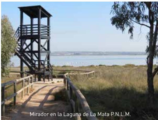
Mirador en la Laguna de La Mata P.N.L.M.

Los observadores de aves conocedores de la costa mediterránea recordarán parajes tan emblemáticos como el Parque Natural El Hondo en Elche-Crevillente, las Salinas de Santa Pola, la Desembocadura del río Segura en Guardamar o las Lagunas de Sal de La Mata y Torrevieja, todo a menos de 15 minutos en coche desde su alojamiento en Guardamar.