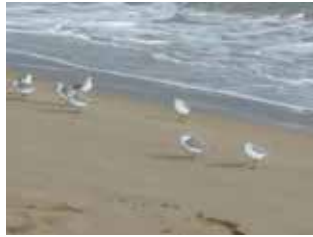
Correlimos tridáctilo ( Calidris alba ) en la playa Les Ortigues de Guardamar J.C.M.

Si es usted un apasionado de las aves, ya sea un aficionado entusiasta o un profesional experimentado, Guardamar y la zona sur de la Costa Blanca les ofrecen una amplia variedad de especies peculiares, así como otras más comunes. Una abundante avifauna que impresionaría a cualquier observador europeo. Las temporadas migratorias de primavera y otoño traen consigo, por supuesto, a muchas aves acuáticas. Esto es un plus para los observadores acuáticos que podrán ver de cerca una gran cantidad de especies que no podemos enumerar en un espacio tan breve.