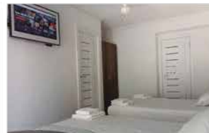
Pensión Centro C/ Miguel Hernández, 14 Tel. 625 20 00 92 www.centrobnbguardamar.com