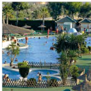
Camping Alannia Guardamar Ctra. Alicante - Cartagena N-332, Km 73,4 Tel. 965 484 945 www.alanniaresorts.com