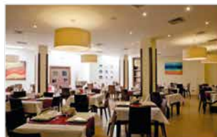
Hotel Quino** C/ Luis Rivera, 94 Tel. 96 572 71 76 www.hotelquino.com