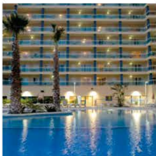
Apartamentos Turísticos Europa House Sun Beach Avda. del Port, 3 Tel. 865 688 878 www.europahousesunbeach.es