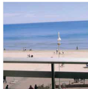
Apartamentos Turísticos Rent Guardamar C/ Jorge Juan, 2 Tel. 96 572 92 13 www.hoteledenmar.com/apartamentos-guardamar.html