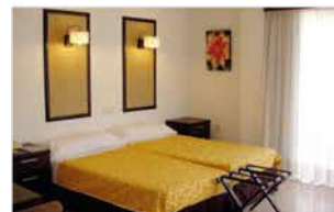
Hotel Eden Mar** Avda. Mediterrani, 19 Tel. 96 572 92 13 www.hoteledenmar.com