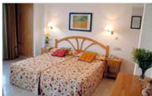
Hotel Levante* Avda. Llibertat, 2 Tel. 96 572 73 46 www.hotellevante.es