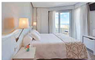
Hotel Meridional**** Avda. de la Llibertat, 64 Tel. 96 572 83 40 www.hotelmeridional.es