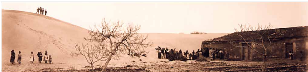
ARENALES AMENAZANDO LA PARTE NORTE DEL PUEBLO EN 1901.

La destrucción y abandono de la villa amurallada de Guardamar se produjo como consecuencia de los terremotos de 1829, obligando a sus habitantes a desplazarse al llano y a construir una población de nueva planta.