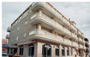
Hotel Parquemar*** C/ Gabriel Miró, s/n Tel. 96 672 51 72 www.parquemarhotel.com