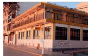
Hotel Europa* C/ Jacinto Benavente, 1 Tel. 96 572 90 55