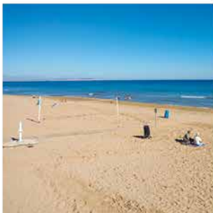
Apartamento Turístico Azorín C/ Azorín, 7 Tel. 626 73 52 53