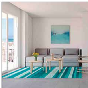
Apartamento Turístico Amapola C/ Argentina, 56 Tel. 96 572 83 40 www.hotelmeridional.es