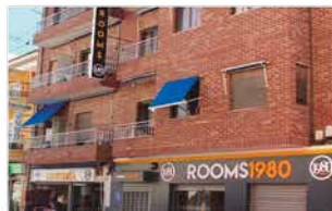
Pensión Rooms 1980 Avda. País Valencià, 49 Tel. 96 672 72 55 www.pensionjaen.es