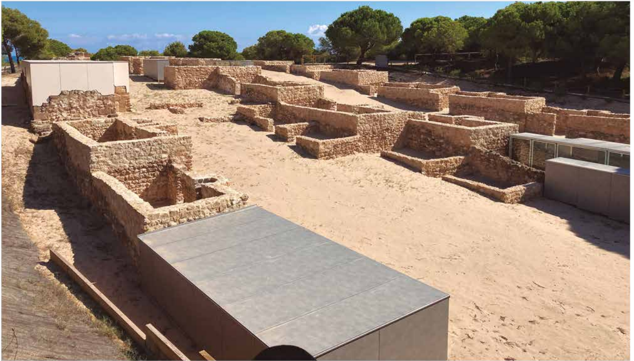
RÁBITA CALIFAL DE GUARDAMAR S.X

Guardamar atesora un rico legado arqueológico producto de su privilegiada situación y variedad de ecosistemas.