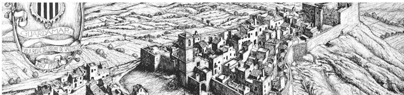
GUARDAMAR EN 1700. GRABADO DE FRANCESC ARACIL.

La estratégica situación de Guardamar junto a la desembocadura del Segura y los recursos naturales de su entorno han favorecido un asentamiento casi ininterrumpido de hombres y culturas, destacando fenicios, iberos, romanos y árabes.