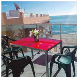
Apartamentos Turísticos Marjal Tel. 656 96 75 33