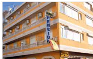
Pensión Trinidad C/ Crevillent, 18 Tel. 96 572 80 57