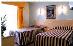
Hotel Mediterráneo** C/ Cartagena, 26 Tel. 96 572 94 07 www.hotelmediterraneo.es