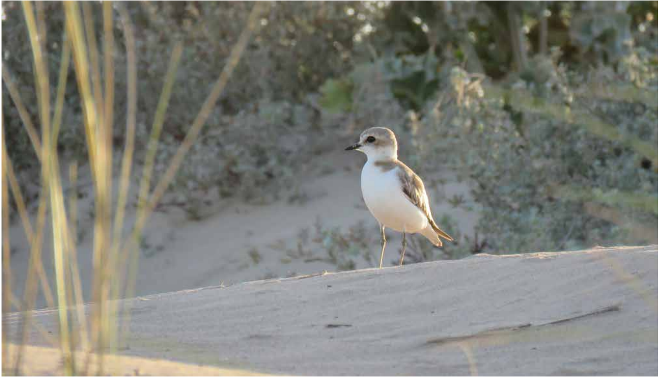
JUVENIL DE CHORLITEJO PATINEGRO ( CHARADRIUS ALEXANDRINUS ).

Guardamar y la zona sur de la Costa Blanca ofrecen una amplia variedad de especies peculiares, así como otras más comunes.