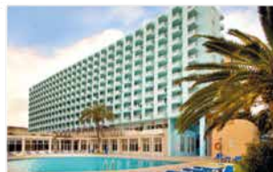
Hotel Playas de Guardamar*** C/ Grecia, 1 Tel. 96 572 80 00 www.hotelesposeidon.com