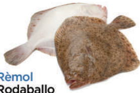
Rèmol Rodaballo Turbot Turbot