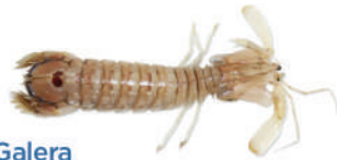
Galera Galera Mantis shrimp Cigale de mer

El consum de peix és imprescindible en una alimentació equilibrada i en la dieta mediterrània. El peix és font de proteïnes d'alt valor biològic, aminoàcids essencials, vitamines i minerals. Posseeix un baix contingut en greixos saturats i alt en àcids grassos cardiosaludables omega 3.