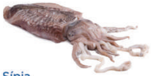
Sípia Sepia Cuttlefish Seiche