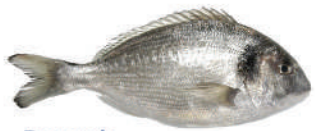
Daurada Dorada Gilt-head bream Daurade