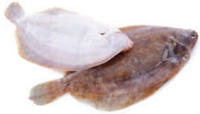
Llenguado Lenguado Sole Sole